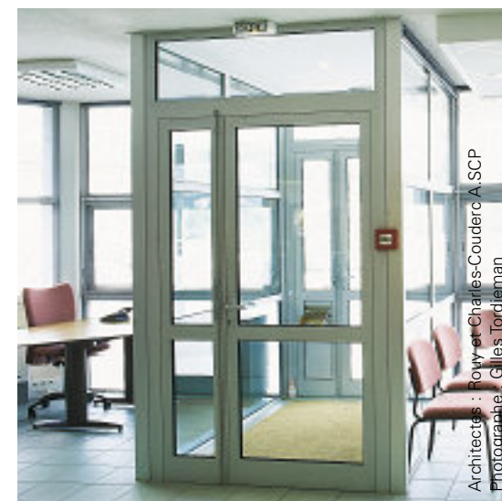
Architectes : Royer et Charles-Coudere A SCP