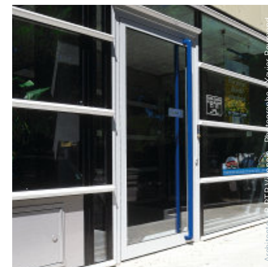
Architecte : B. P.T.P. Vinnols