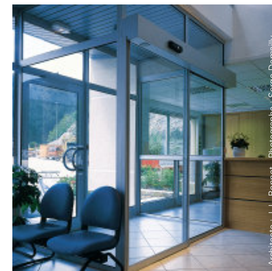
Architecte : J.-L. Bonnet