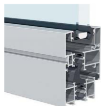
Contemporaine Des lignes droites pour une esthétique épurée au top du design.